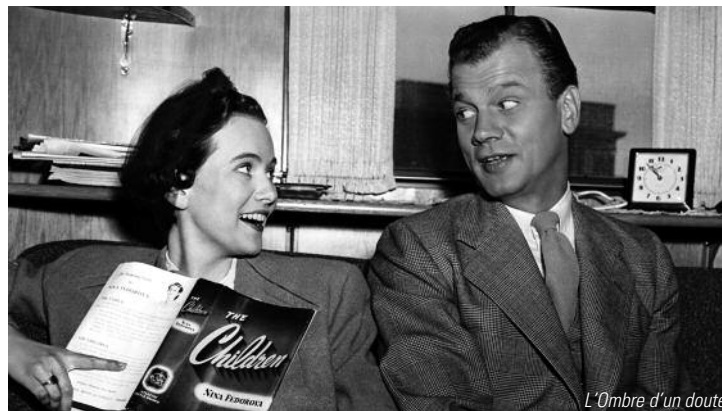
L'Ombre d'un doute