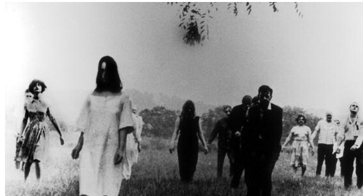
La nuit des morts vivants, George A. Romero