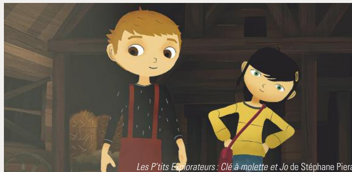
Les P'tits Explorateurs: Clé à molette et Jo de Stéphane Piera

En complément de programme : Chemin d'eau pour un poisson de Mercedes Marro; Le Renard minuscule de Aline Quertain et Sylwia Szkilad; La Cage de Loïc Bruyère.