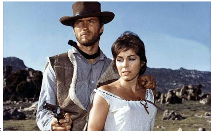
Pour une poignée de dollars

Le film annonce ; le document pédagogique.