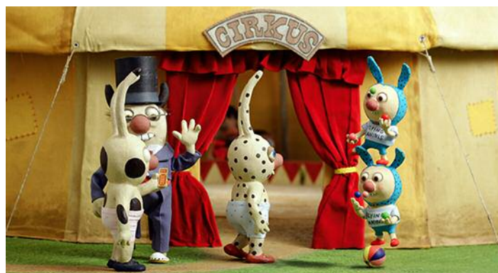
Les Nouvelles Aventures de Gros-pois et Petit-point